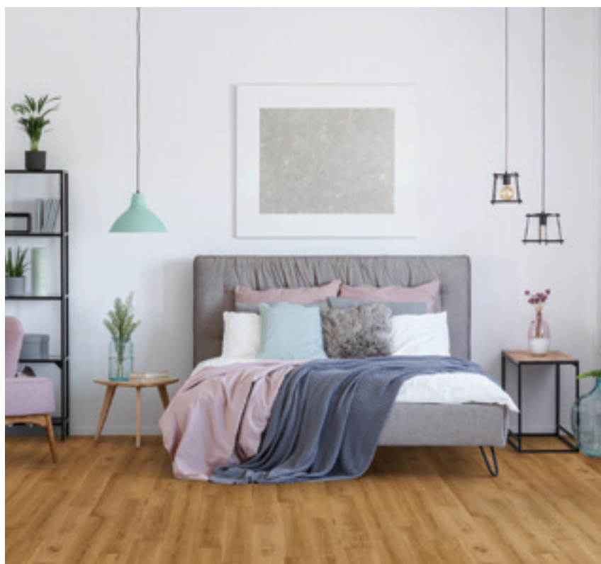
Les nouvelles technologies permettent aujourd'hui de reproduire l'aspect du bois avec un rendu particulièrement réaliste. 52 €/m 2 . www.wicanders.com

Et si vous optiez pour un sol bénéficiant des dernières technologies ? Rassurez-vous, il ne s'agit pas de vous convertir aux revêtements digitaux et tactiles. Mais plutôt de sélectionner un sol profitant des meilleures techniques d'impression numérique. L'intérêt ? Proposer des revêtements au rendu ultraréaliste. C'est le cas de la nouvelle collection Wood Essence dont les 14 nouveaux looks reproduisent l'aspect du bois avec une précision jamais atteinte. Outre l'aspect graphique, cette technique est également plus respectueuse de l'environnement puisque l'imprimé est réalisé directement sur le liège évitant le recours aux PVC ou autres matières synthétiques qui alourdissent le bilan carbone des produits.