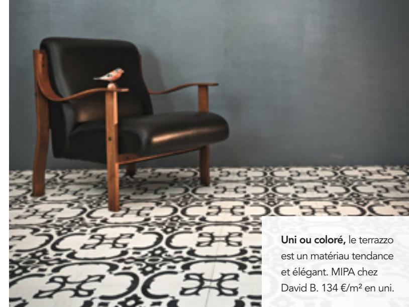
Uni ou coloré, le terrazzo est un matériau tendance et élégant. MIPA chez David B. 134 €/m 2 en uni.

Les tatouages iD Tatroo peuvent être appliqués par petites touches ou sur une zone spécifique. Prix sur demande. www.tarkett.fr