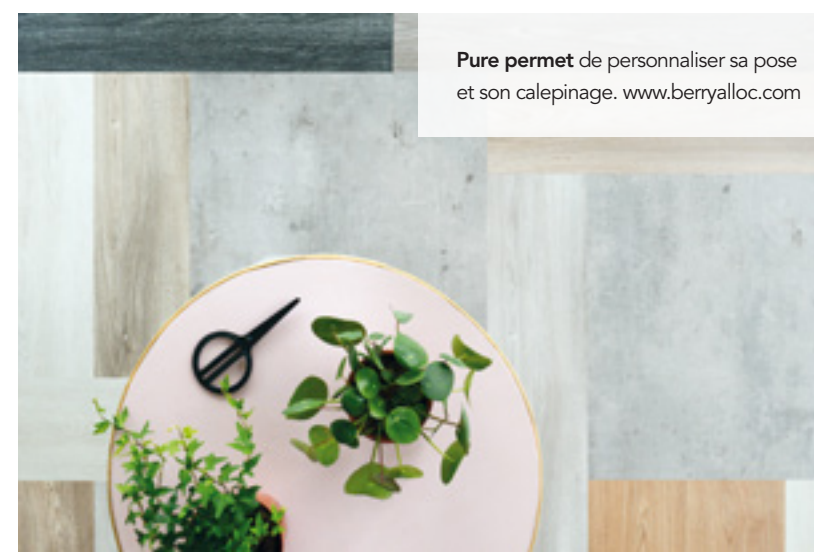
Pure permet de personnaliser sa pose et son calepinage. www.berryaloc.com

En matière de décoration, nous sommes entrés dans l'ère de la personnalisation. Les solutions de sols modulaires ont pris de l'ampleur ces dernières années. Le concept ? Permettre à chaque client de confectionner son propre sol à partir d'une déclinaison de couleurs, de textures et de tailles de lames. Le vinyle se prête naturellement bien à ce type d'exercice. La Collection Pure va encore plus loin dans les possibilités décoratives grâce au système de pose DreamClick®. Equipé d'un système de verrouillage à 360°, il permet de personnaliser le sens de pose : Parquet à l'anglaise ou à la française, en échelle ou à bâton rompu. Le calepinage pourra également être déterminé par les clients avec notamment la création de motifs sur mesure. ■