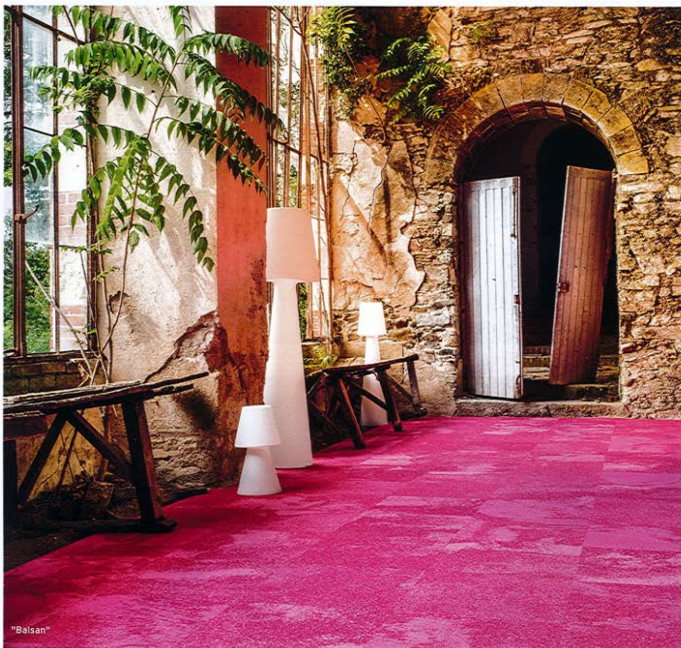
▲ Herzlich willkommen in der neuen Lebenskunst von Frankreichs Marktführer

Kreationen des französischen Marktführers spiegeln den Chic à la française für alle Office-Bereiche wider. Entdecken Sie die Kollektionen, die von der Natur oder den urbanen Landschaften inspiriert sind. Sie geben Ihren Räumen das gewisse „Etwas“. Kollektionen, die jeden Ort prä-